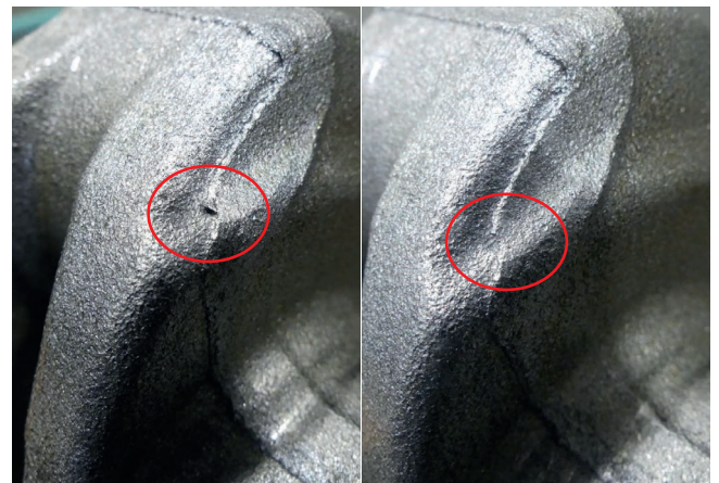
Entfernen von produktionsbedingten Graten

Im URACA Technikum können verschiedenste Versuche praxisnah und reproduzierbar durchgeführt werden. Oft klärt erst ein Versuch, ob die gesteckten Ziele mittels Hochdruck erreicht werden. Die dabei ermittelten Parameter gewährleisten, dass für jeden Anwendungsfall das optimale Aggregat mit dazugehörigem Zubehör zum Einsatz kommt. In den zwei Reinigungskabinen mit Industrierobotern können sehr individuelle Tests mit speziellen Konstruktionen durchgeführt werden.