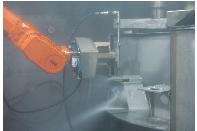
Reinigung von Klein-Serien