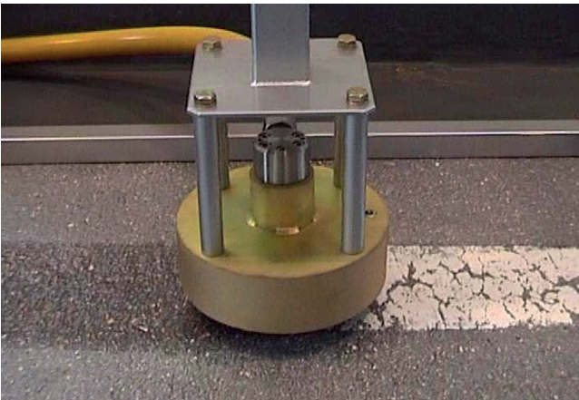
Demarkierungstest, vorher und nachher