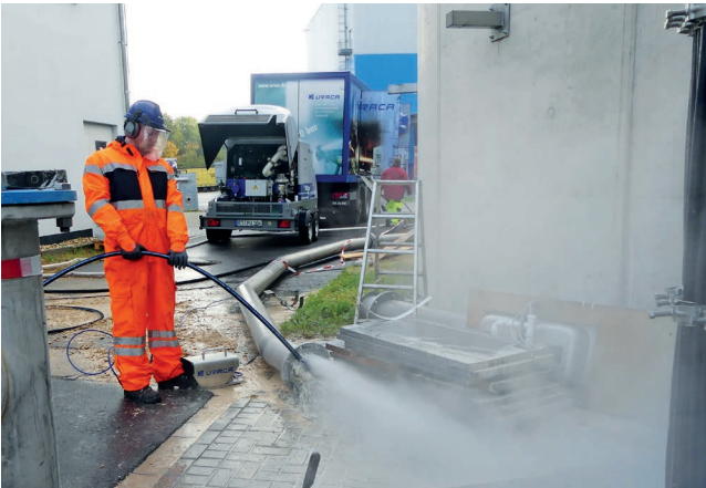
Rohrreinigung mit Fußventil