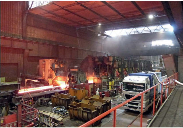
Entzündungstests beim Kunden