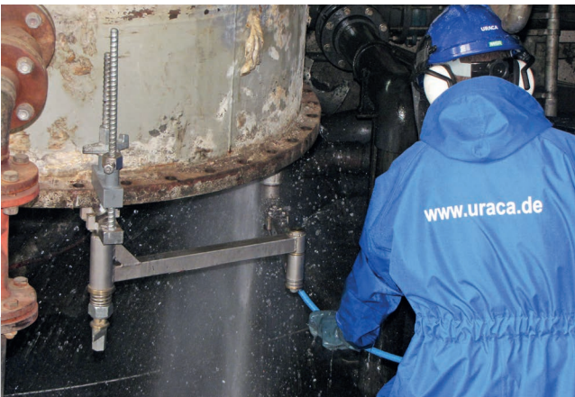
Wärmetauscherreinigung mit Rückhaltevorrichtung