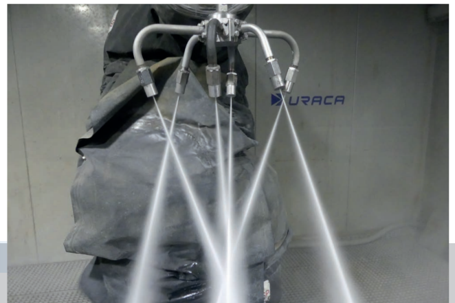
Sonder-Zubehöre für spezielle Anwendungen

Deutliche Kostensenkung durch Verbesserung der Reinigungsdauer und des Ergebnisses durch effizienteres Reinigungszubehör ergibt einen größeren Unternehmenserfolg. Eine exakte Parameterbestimmung ist die Grundlage für eine optimale Angebotserstellung. Sondervorrichtungen können genutzt werden ohne kostspielige Anschaffung.